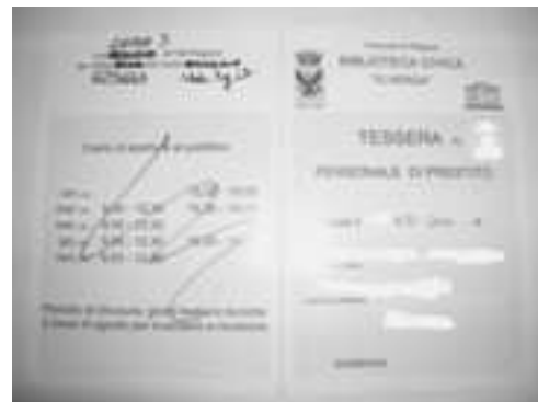
Tessera i cartuni (Ragusa)