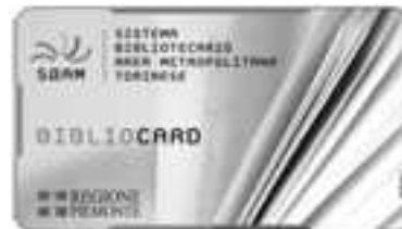
Tessera magnetica (Torino)